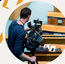
Journalisten kunnen tijdens de debatten plaatsnemen op de publieke tribune en houden onderling afstand.