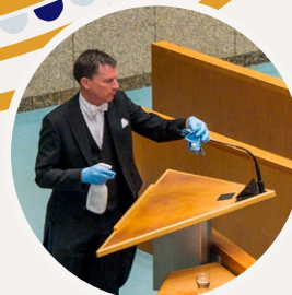
Tijdens en na afloop van de debatten wordt het meubilair extra schoongemaakt.