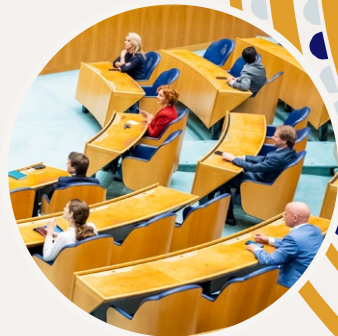
De aanwezigen in de plenaire zaal houden anderhalve meter afstand.