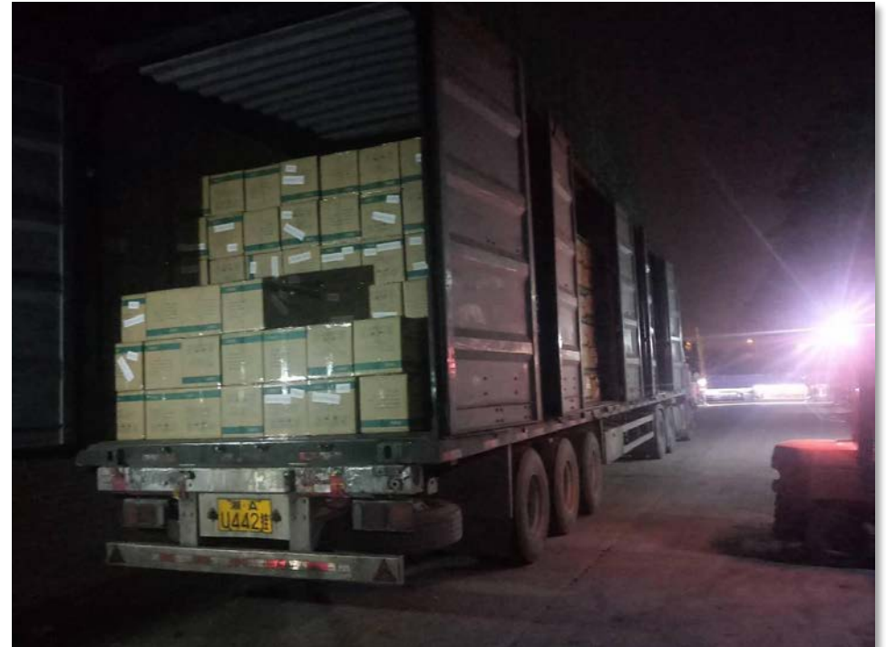
0,9 mln. FFP2 onderweg voor LCH