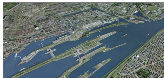
Afbeelding 2: overzichtkaart van het onderzoeksgebied.

Het gebied voor het project ligt deels in de Gemeente Velsen (zie afbeelding 2). De gemeente Velsen zet in op verduurzamen. Dat windenergie hierin een belangrijke rol zou krijgen, lag gezien het gunstige windklimaat in Velsen voor de hand. Windpark Spuisluis zal met 6 windmolens grofweg zo'n 75.000 MWh aan elektriciteit opleveren. De gemeente Velsen wil in 2020 qua elektriciteit energieneutraal zijn voor alle huishoudens. Het windpark levert voldoende energie op om 90% van de woningen van elektriciteit te voorzien.