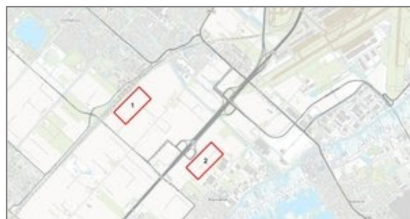
Afbeelding 1: Mogelijke locatie hoogspanningsstation (kabeltracés niet opgenomen)

De energievraag in de Haarlemmermeer neemt toe. Dat komt onder andere doordat datacenters zich in het gebied willen vestigen, glastuinbouwers willen uitbreiden en bestaande bedrijven zich verder willen ontwikkelen. De beschikbare capaciteit in het elektriciteitsnetwerk is rond 2017 niet meer voldoende om aan de vraag te voldoen. Om de levering van elektriciteit in de regio in de toekomst te kunnen garanderen zijn aanpassingen nodig in het elektriciteitsnet.