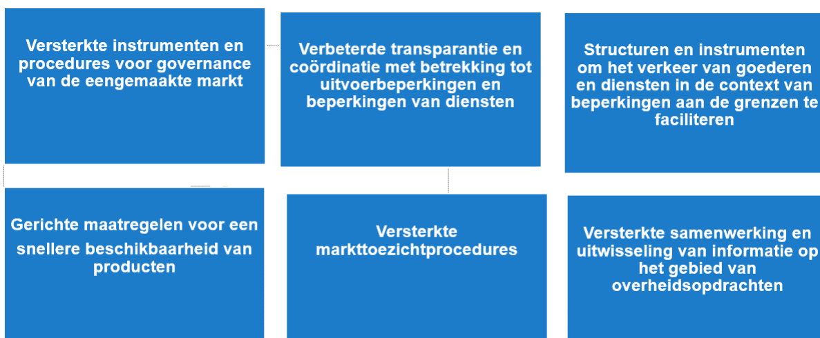
Figuur 2: Sleutelementen van het noodinstrument voor de eengemaakte markt

Ondanks het nut van de bestaande instrumenten van de eengemaakte markt heeft de crisis aangetoond dat deze voor noodsituaties kunnen worden verbeterd. Zoals aangekondigd door voorzitter Von der Leyen in februari 2021 16 zal de Commissie een noodinstrument voor de eengemaakte markt voorstellen als structurele oplossing om de beschikbaarheid en het vrije verkeer van personen, goederen en diensten in de context van mogelijke toekomstige crises te waarborgen. Dit instrument moet zorgen voor meer informatie-uitwisseling, coördinatie en solidariteit wanneer de lidstaten crisisgerelateerde maatregelen nemen. Het zal de negatieve gevolgen voor de eengemaakte markt helpen beperken, onder meer door te zorgen voor een doeltreffendere governance. Het moet ook een mechanisme opzetten aan de hand waarvan Europa kritieke producttekorten kan aanpakken door de beschikbaarheid van producten te versnellen (bv. het vaststellen en delen van normen, versnelde conformiteitsbeoordeling) en de samenwerking op het gebied van overheidsopdrachten te versterken. Het zal worden afgestemd op relevante beleidsinitiatieven, zoals het komende voorstel tot oprichting van een Europese autoriteit voor paraatheid en respons inzake noodsituaties op gezondheidsgebied (HERA), het komende noodplan voor vervoer en mobiliteit en de relevante internationale praktijk die gericht is op het aanpakken van noodsituaties of het waarborgen en versnellen van de beschikbaarheid van essentiële producten.