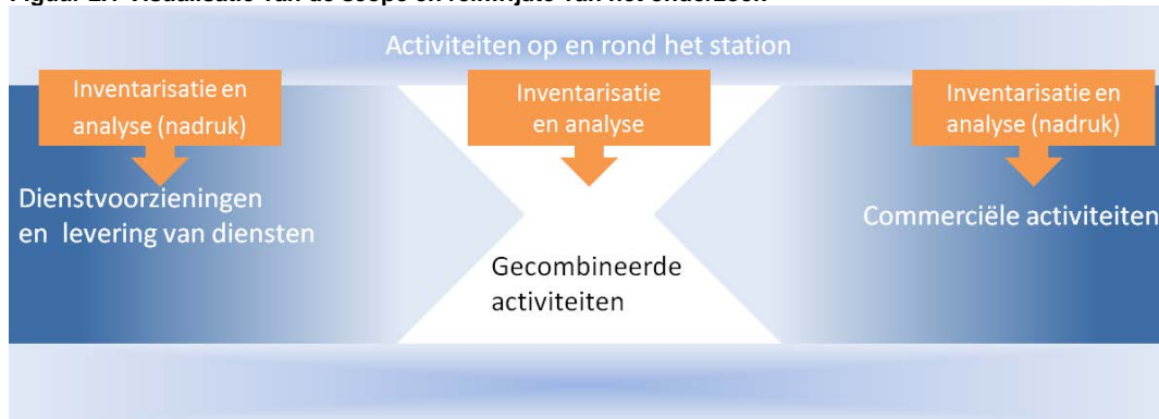
Figuur 2.1 Visualisatie van de scope en reikwijdte van het onderzoek