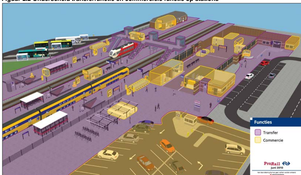
Figuur 2.2 Onderscheid transferfunctie en commerciële functie op stations

De transferfunctie omvat alles wat met het vervoer van personen via het station te maken heeft. De commerciële voorzieningen zijn die voorzieningen die niet noodzakelijk zijn voor het maken van de reis. De reiziger maakt zelf de keuze om al dan niet gebruik van de commerciële voorziening te maken. De volgende figuur visualiseert het onderscheid transfer en commercie op een station. De dienstenvoorzieningen (zie paragraaf 2.1.2) maken onderdeel uit van de transferfunctie.