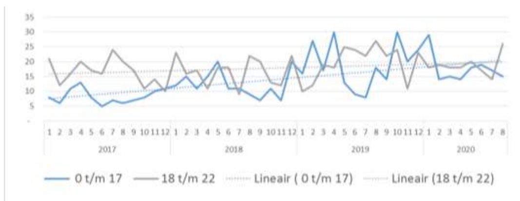
Grafiek 1. Aantal unieke steekincidenten met verdachte, 2017-2020

De laatste zes jaar ziet de politie een grillig maar stabiel patroon van 50 tot 140 steekincidenten per maand, ongeacht de leeftijd van de betrokken daders. Als gekeken wordt naar de categorie jonge verdachten, waaronder zowel minderjarigen als jongvolwassenen tot 23 jaar vallen, dan is vanaf 2017 op landelijk niveau een lichte toename van betrokkenheid bij steekincidenten te zien. Er is een sterkere stijging van het aantal steekincidenten in de leeftijdsgroep van 0 tot en met 17 jaar dan in de groep van jongvolwassenen.