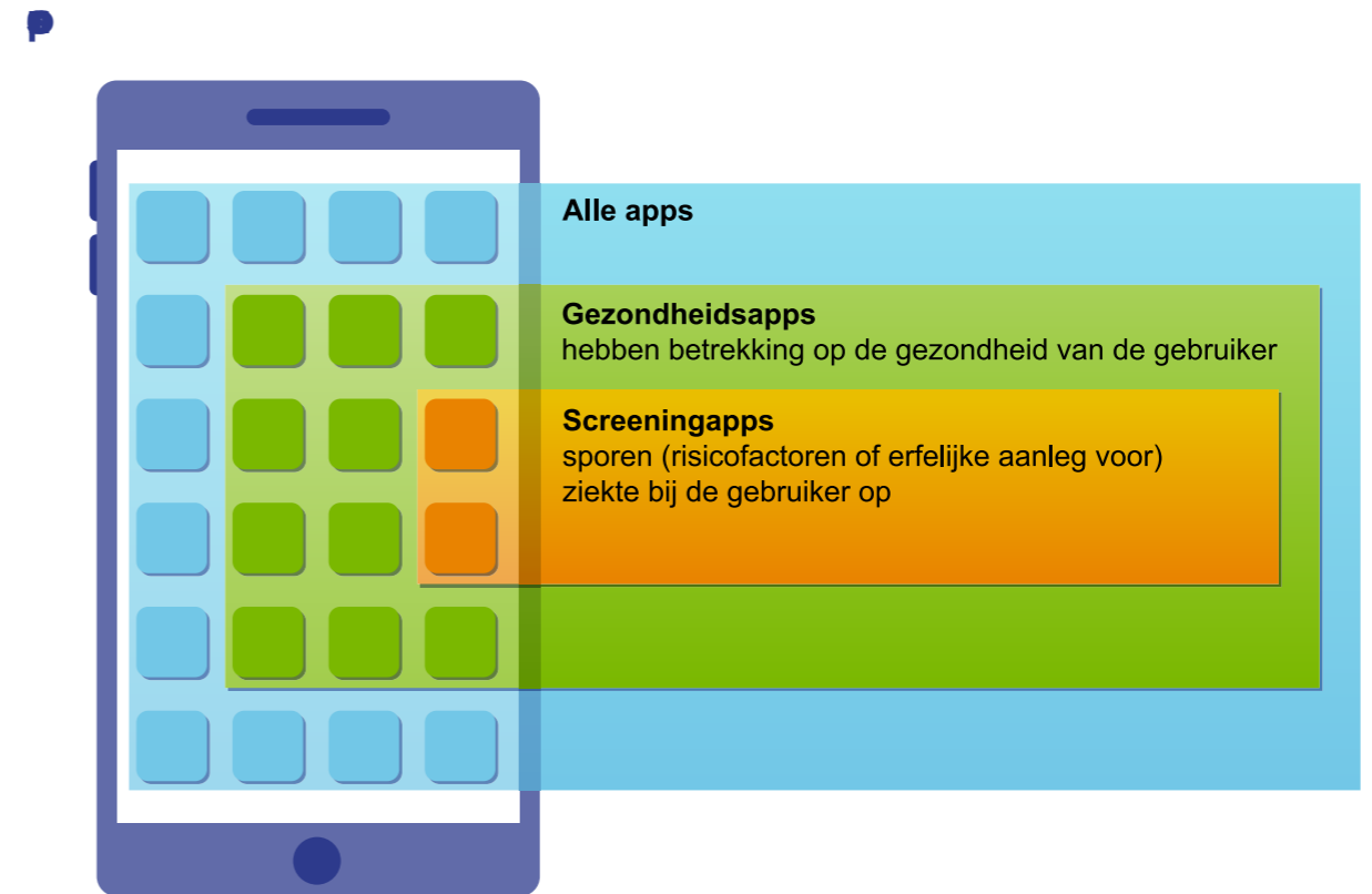
Figuur 2 Reikwijdte advies

Screeningsapps zijn gezondheidsapps die door de overheid worden ingezet om ziekte te voorkomen of vroegtijdig op te