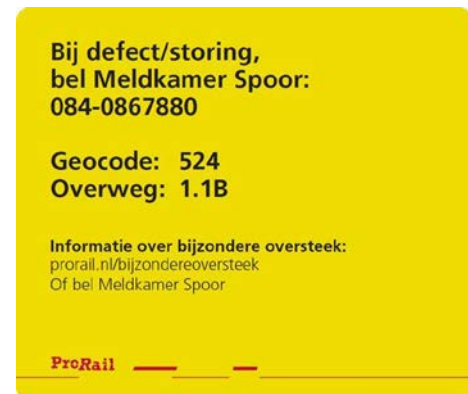
Figuur 4. Voorbeeld van sticker om overweggebruikers te informeren over een bijzondere oversteek

De inspectie verwacht ook van ProRail dat zij actiever gaat monitoren op bijzondere oversteken. De behandelde aanvragen voor een Bijzondere oversteek geven nog niet het beeld dat alle, vooral bijzondere wegtransporten, de procedure kennen. In het verleden deden zich meerdere ernstige incidenten voor met bijzondere wegtransporten. De inspectie verwacht dat deze transporten meerdere keren per jaar plaatsvinden. Daarbij zouden de overweggebruikers de procedure zeker moeten volgen. De inspectie denkt dat overweggebruikers dat niet altijd doen vanwege de minimale aanvraagperiode van 48 uur.