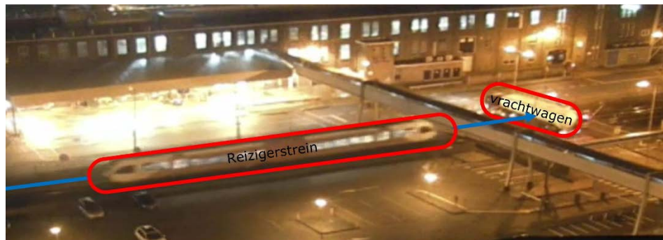
Figuur 5. Still van een beveiligingscamera van de aanrijding op 11 januari 2019 van reizigerstrein 37361 van Arriva (van Leeuwarden naar Groningen) die met een snelheid van circa 80 – 100 km per uur op een melkpoeder beladen stilstaande vrachtwagen botst. De overweg Merodestraat te Leeuwarden is een met automatische halve overwegbomen (AHOB) beveiligde overweg.

Een dergelijk waarschuwingssysteem voor een object op een overweg had mogelijk de aanrijding van 11 januari 2019 kunnen voorkomen of de gevolgen ervan kunnen beperken (Figuur 5) 20 .