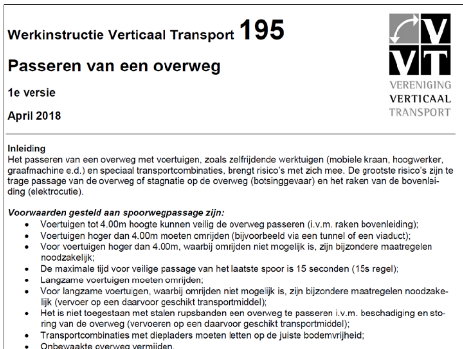
Figuur 3. Fragment van de VVT instructie over het passeren van overwegen.