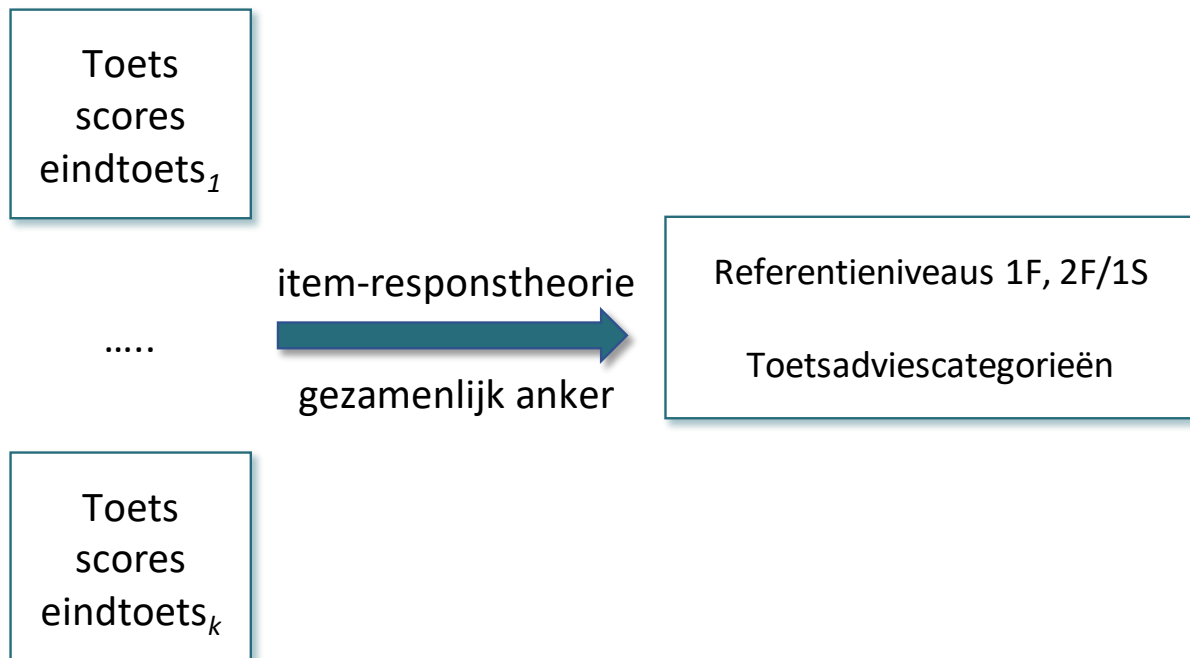
Figuur 1. Grafische weergave IRT1 normeringsmethode

In de tweede fase van de argumentgerichte benadering worden de potentiële risico's in kaart gebracht die kunnen ontstaan bij het volgen van de redenering dat toetsscores op een valide manier omgezet kunnen worden in bijpassende referentieniveaus en toetsadviescategorieën door gebruik te maken van de item-responstheorie en het gezamenlijk anker.