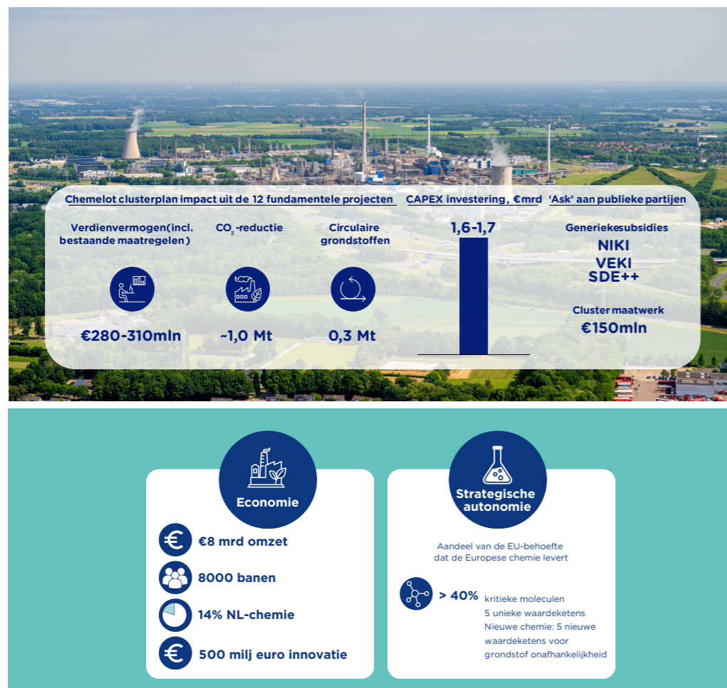
Figuur 1. Clusterplan impact en de ‘ask’ aan publieke partijen

Dit clusterplan is onderbouwd met uitvoerige vertrouwelijke onderliggende analyse- en projectstukken die voor de direct betrokken partijen ter inzage zijn. Die stukken onderbouwen de projectselectie, de impact- en investeringsramingen, de afhankelijkheden, risico's en randvoorwaarden per project. Het clusterplan bevat de hoofdlijn en brengt deze analyses samen in een bestuurlijk en strategisch kader.