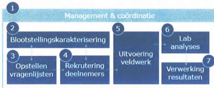
Figuur 1: Onderlinge samenhang van de verschillende werkpakketten.

Binnen deze studie worden taken onderverdeeld in verschillende werkpakketten (Figuur 1).