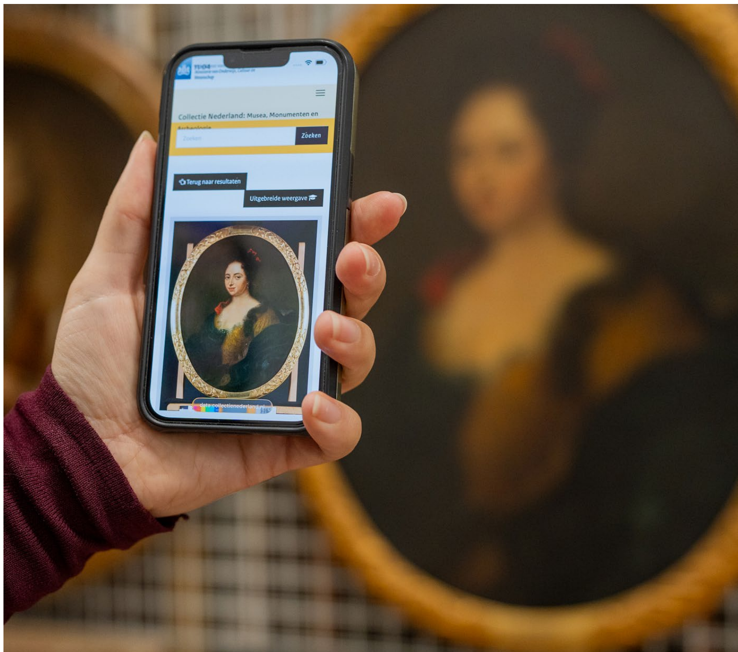
Een groot deel van de rijkscollectie is ook als digitale collectie terug te vinden op CollectieNederland.nl.