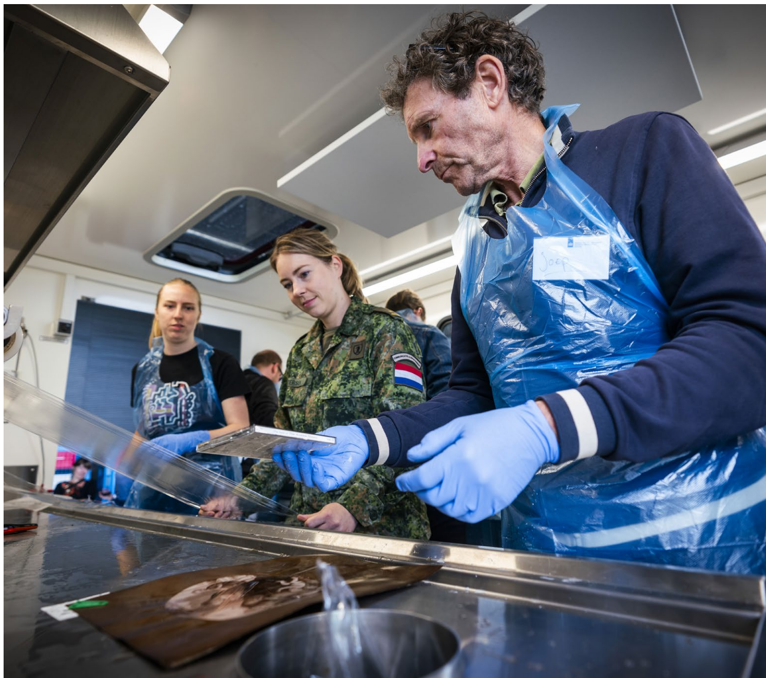
Medewerkers van het Collectie Centrum Nederland, Ministerie van Defensie en studenten van de Reinwardt academie oefenen tijdens de Actiedag Weerbaar Erfgoed in een mobiele noodhulpcontainer met collectiehulpverlening.