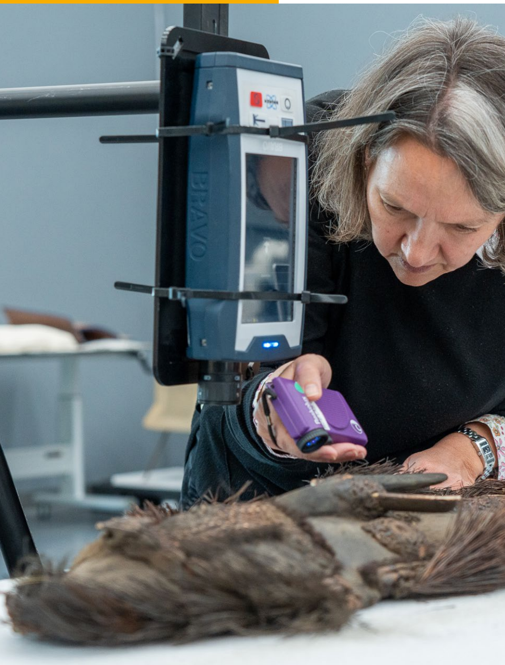
Een onderzoeker van de RCE kijkt met een UV-lamp de materiaalsamenstelling van een masker uit de rijkscollectie.