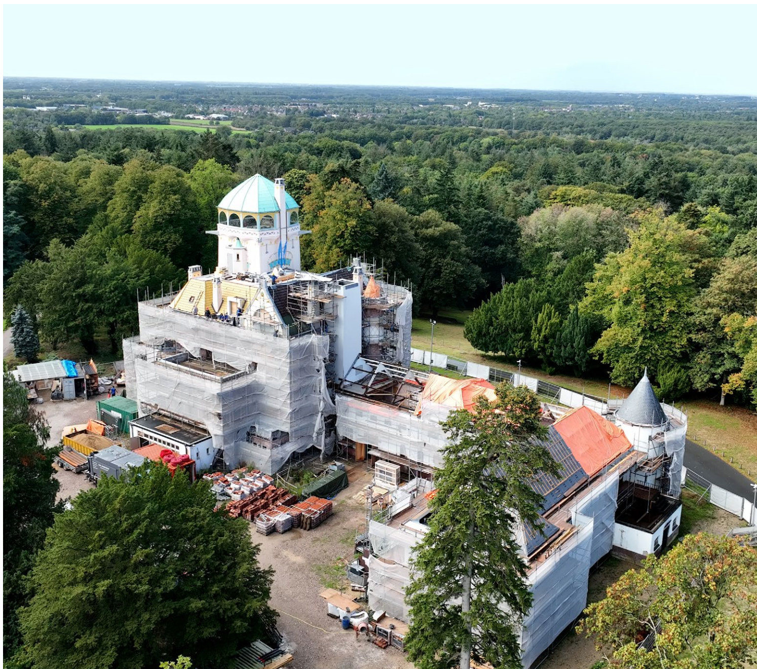
De restauratie van Jachtslot Mookerheide (Natuurmonumenten), waarbij het landhuis is hersteld in originele Jugendstijl, is mede mogelijk gemaakt met middelen uit de Subsidieregeling Restauratie Rijksmonumenten 2019-2020.