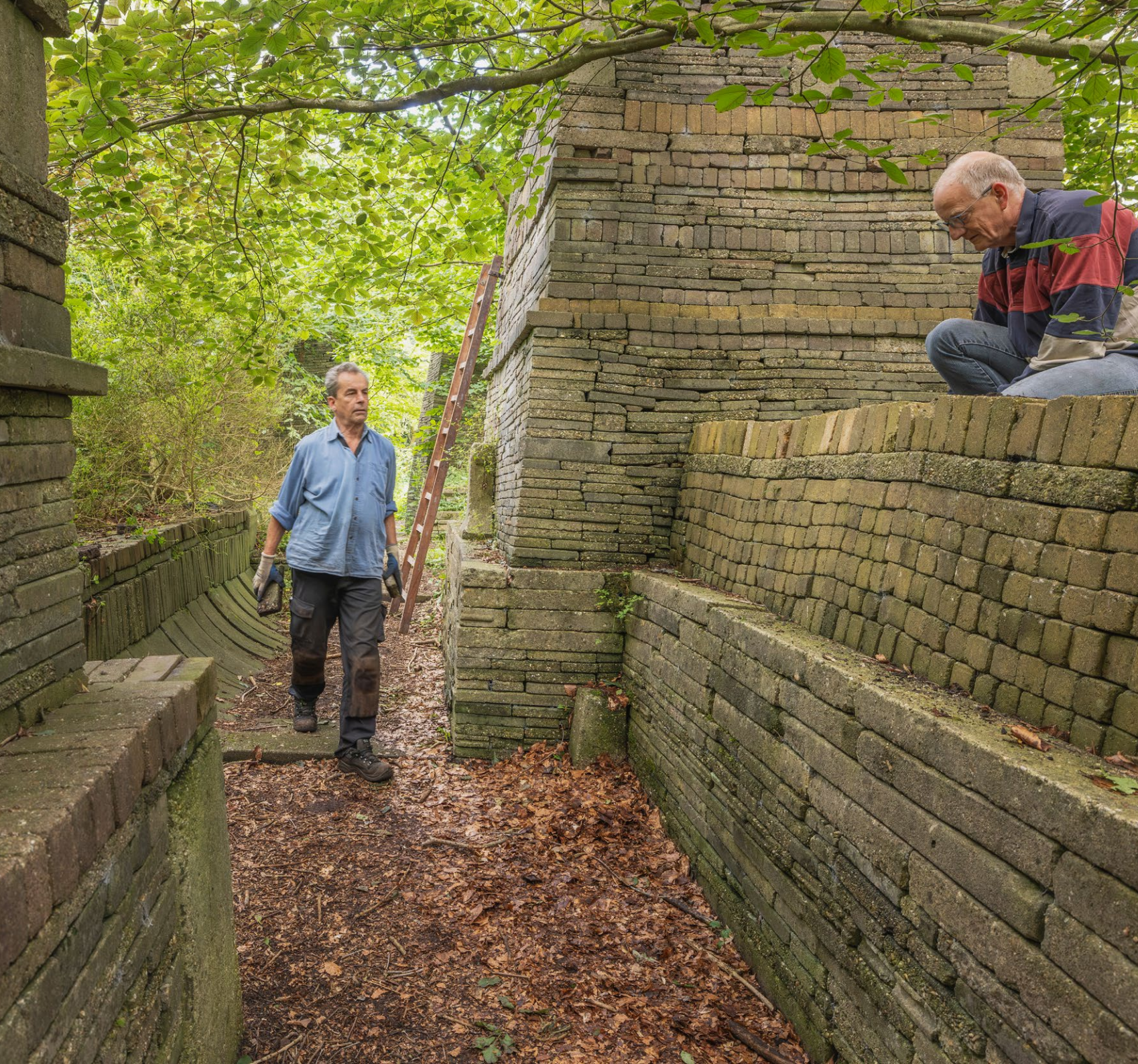
Foto cover: Op dit stuk van de A4 tussen Leiden en Leidschendam is goed zichtbaar hoe infrastructuur en de energietransitie samengaan met het Nederlandse cultuurlandschap.

Foto achter: De Ekokathedraal in Mildam (Friesland) is in 2025 aangewezen als Post65 rijksmonument. Het is een steeds veranderend kunstwerk gecreëerd om langdurige processen tussen mens en natuur te bestuderen.