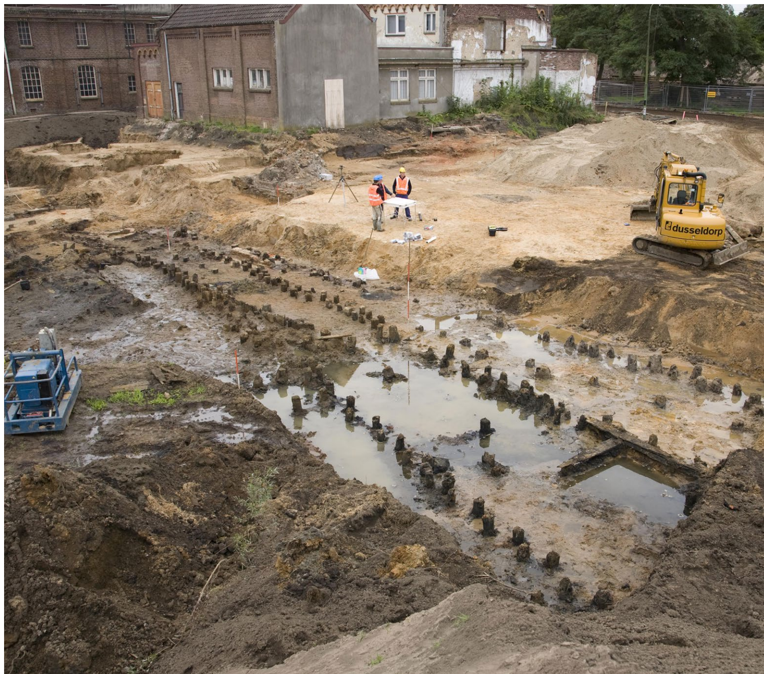
Archeologisch onderzoek door de Rijksdienst voor het Cultureel Erfgoed naar een ijmolen op het terrein van de DRU in Ulft.

Gemeenten zijn als spil in het erfgoedstelsel bijna altijd het bevoegd gezag in de omgang met erfgoed, ook bij ruimtelijke ontwikkelingen. Voor burgers zijn zij het eerstelijnsloket. Maar in een flink aantal gemeenten zijn capaciteit en deskundigheid onvoldoende aanwezig . Daardoor belanden eerstelijnsvragen niet alleen onnodig bij de RCE, maar voldoen ook dossiers die gemeenten opstellen en besluiten die ze nemen geregeld niet aan de inhoudelijke of juridische vereisten. Erfgoed komt in die gevallen binnen ruimtelijke processen in een achterstandspositie terecht. Gebrek aan deskundigheid betekent ook dat adviezen en kennisproducten van de RCE onvoldoende benut (kunnen) worden. Voor sommige terreinen, zoals bouwhistorie of maritieme archeologie, geldt tevens dat weinig gemeenten er beleid voor hebben. Ook dat leidt tot meer vragen aan de RCE. Deze druk op het werk wordt niet alleen verder verhoogd door het toenemende belang van participatie, maar ook door de taakstelling bij de rijksoverheid zelf. Dit >>