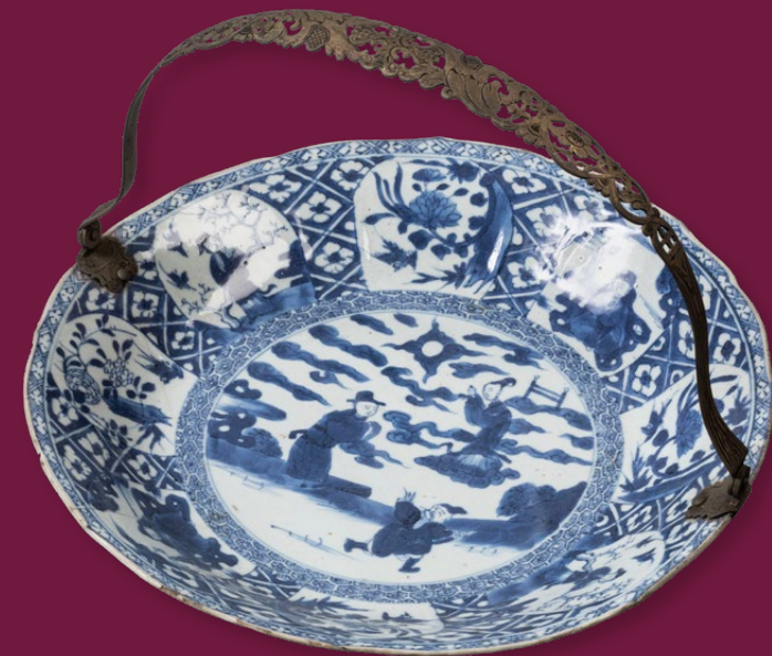
Bord met zilveren hengsel, maker onbekend, 1800-1899, porselein en zilver, 27 cm. Inventarisnummer NK-collectie: NK292

Collectie Rijksdienst voor het Cultureel Erfgoed, https://wo2.collectienederland.nl , NK292.