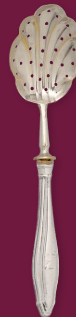
Strooilepel, maker onbekend, verzilverd metaal, 1900-1929, 14,8 cm. Inventarisnummer: NK3591

Collectie Rijksdienst voor het Cultureel Erfgoed, https://wo2.collectienederland.nl, NK3591 .