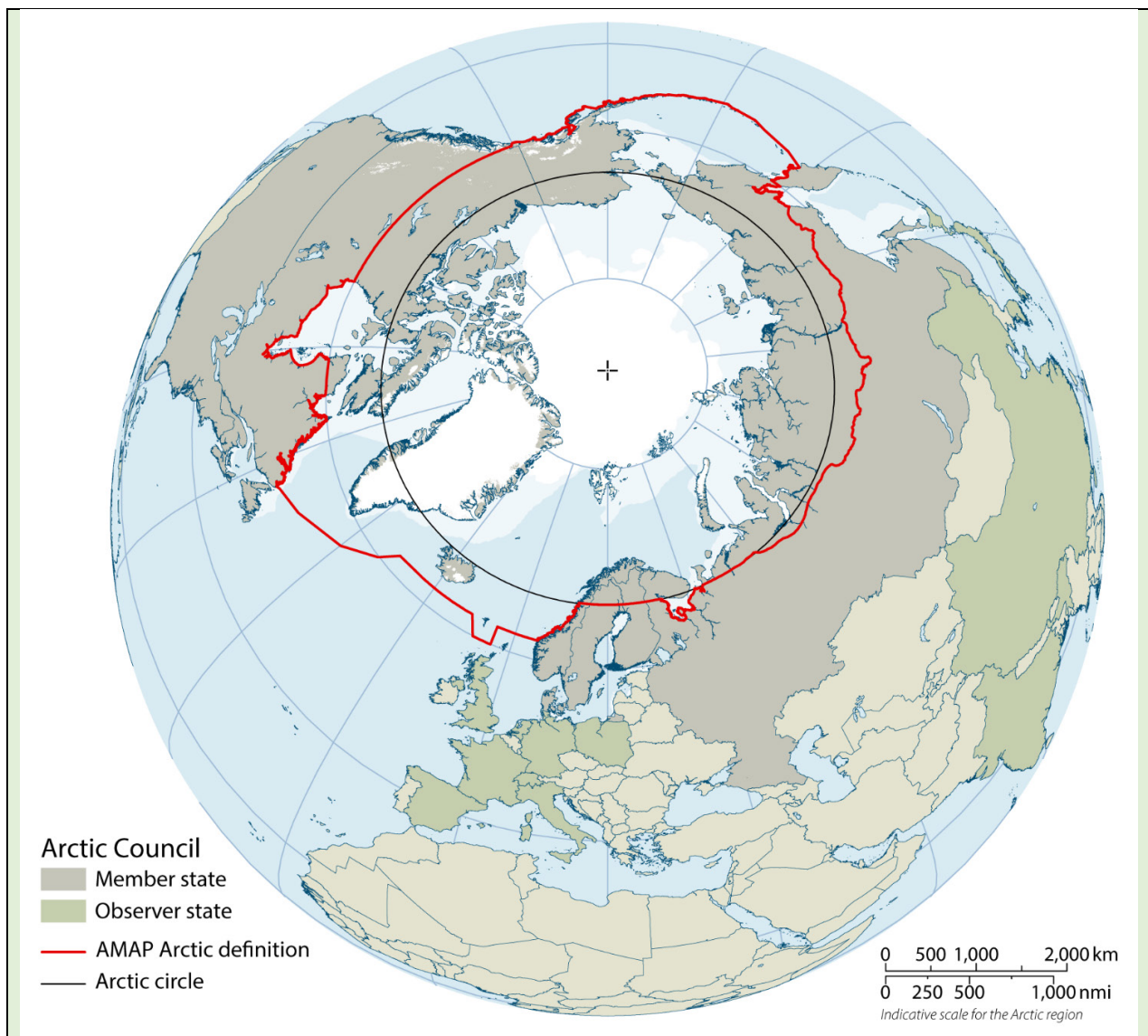
Figuur 1: de AMAP-definitie van het noordpoolgebied die door Nederland wordt gebruikt.