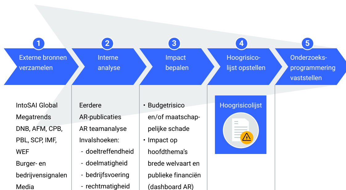
Figuur 1 bijlage 1 Selectieproces van de Hoogrisicolijst Stapsgewijs selectieproces Hoogrisicolijst van de Algemene Rekenkamer