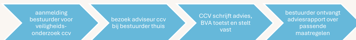
Figuur 2.1 Beveiligingsadvies op maat aanvragen

De bestuurder en werkgever zijn verantwoordelijk voor de uitvoering van de maatregelen uit het rapport. Daarbij treft de bestuurder maatregelen op basis van vrijwilligheid. Gemeenten, provincies en waterschappen zijn op basis van de Regeling verplicht om vanuit hun rol als werkgever de geadviseerde maatregelen uit te voeren en te bekostigen . Wel geldt daarbij de eis dat voor de woning van de bestuurder een geldig Politiekeurmerk Veilig Wonen-certificaat is afgegeven, tenzij van de voorzitter of het lid van het dagelijks bestuur redelijkerwijze niet kan worden gevergd dat aan deze eisen wordt voldaan. Voor de bekostiging van de beveiligingsmaatregelen krijgen alle gemeenten en provincies dezelfde tegemoetkoming vanuit het ministerie van BZK van ruim 7.000 euro per jaar (jaarlijks geïndexeerd), in de vorm van een decentralisatie-uitkering. (Zie ook figuur 2.2.)