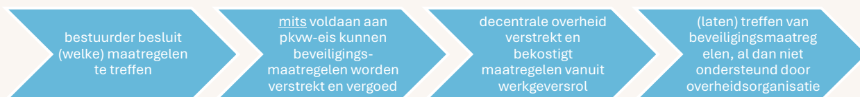
Figuur 2.2 Uitvoering en bekostiging van de beveiligingsmaatregelen