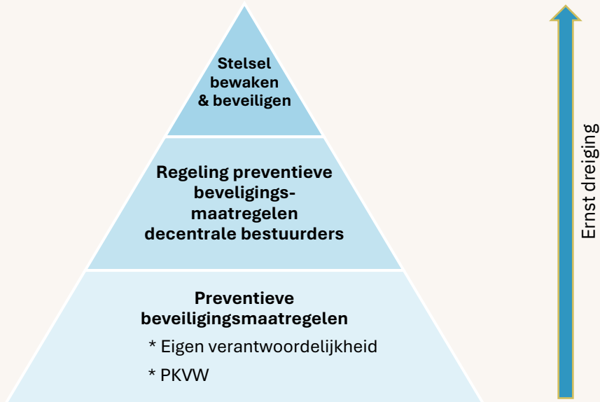
Figuur 2.3 Bredere systematiek beveiliging

De (dynamische) verhoudingen tussen de niveaus zijn hieronder weergegeven in figuur 2.3.