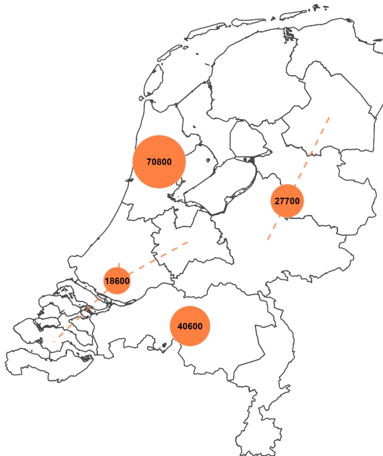
Figuur 2.2 Spreiding van de scholierenbezoeken aan (de locatie van) de twaalf instellingen naar provincie

De scholierenbezoeken aan de twaalf instellingen zijn niet evenredig verdeeld over de verschillende regio's in het land (zie Figuur 2.2)