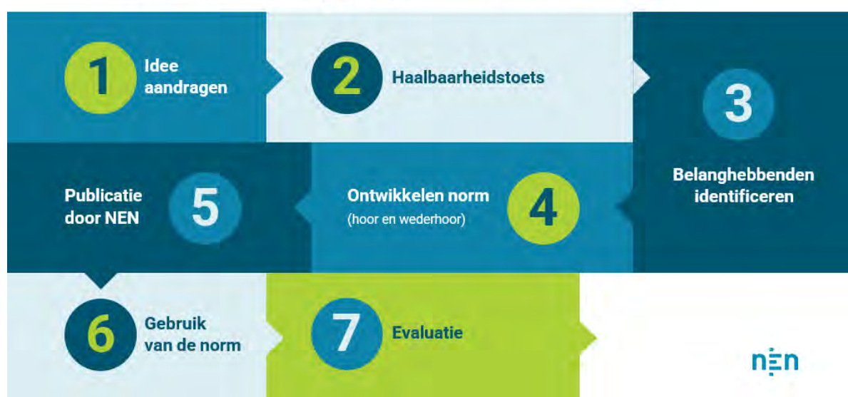
Afbeelding 1, de zeven stappen van normalisatie.

De leidraad 'Duurzame medische hulpmiddelen: single-use én reusable' opgesteld door het NEN Platform Duurzaamheid & Medische Hulpmiddelen is gebruikt als basisinformatie voor deze verkenning. De leidraad is opgesteld door een brede groep stakeholders en biedt een handvat aan de sector om binnen de huidige wet- en regelgeving stappen te zetten op het gebied van de verduurzaming van medische hulpmiddelen.