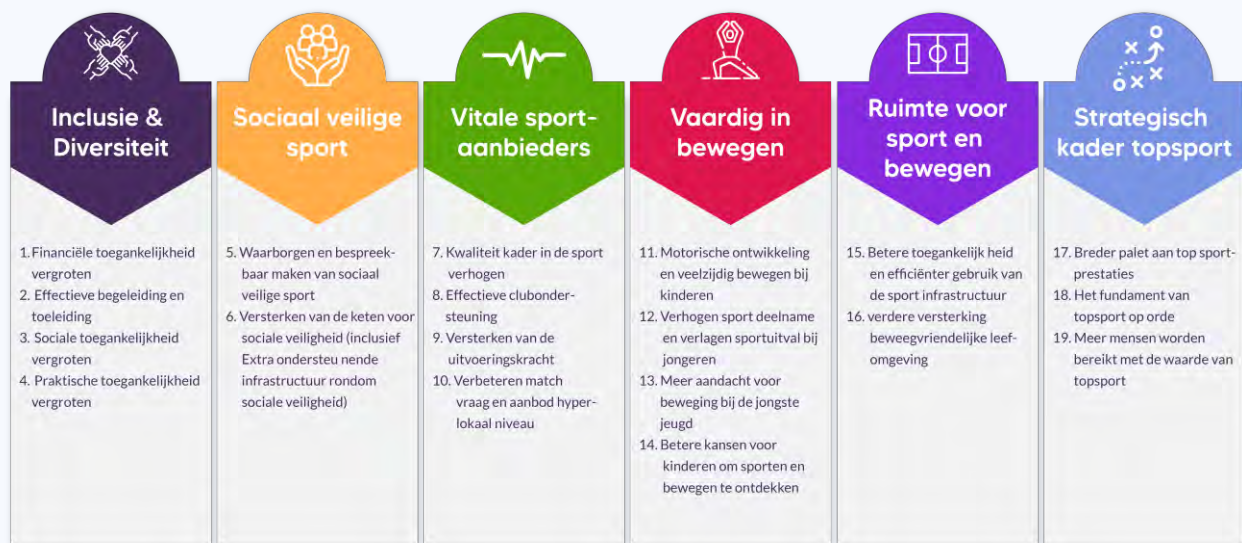
Figuur 1.1 Sportakkoord II: thema's en opgaven

Per thema zijn twee tot vier opgaven geformuleerd. In totaal zijn er negentien opgaven (zie figuur 1.1 ). In de vorige voortgangsrapportage (Hoogendam et al., 2024) staat de achtergrond van SAIL nader toegelicht.