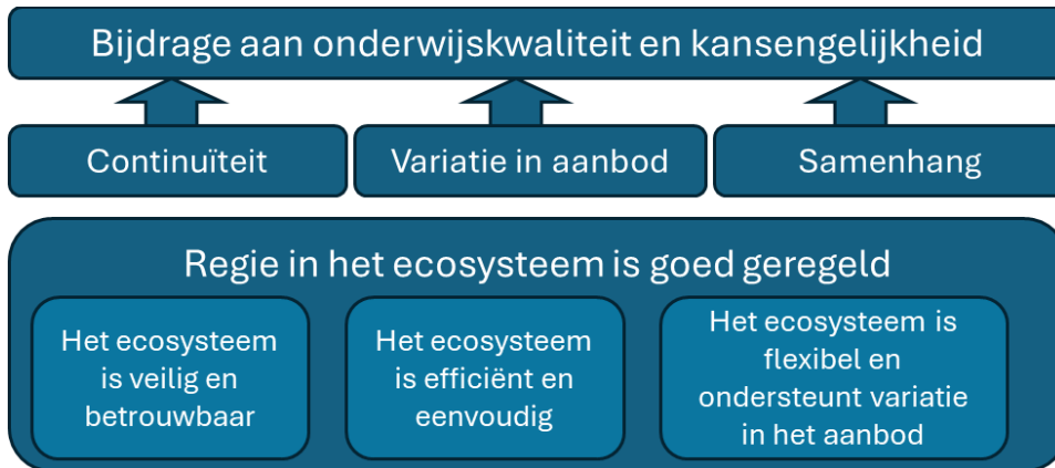
Figuur 3.1: doelstelling en ambities

Hieronder geven we e.e.a. schematisch weer: