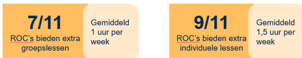
Figuur 5. Aantal roc's in de enquête die extra lessen aanbieden

De vorm en mate van extra ondersteuning voor het vak Nederlands verschillen tussen roc's. We blijkt uit de enquête en interviews met docenten dat elk roc wel een vorm van extra ondersteuning aanbiedt. Vaak gaat dit om extra lessen, in groepsverband of individueel. Alle docenten die wij spraken zijn tevreden over de mate van ondersteuning die hun roc biedt aan studenten die moeite hebben met de taaleis IKK.