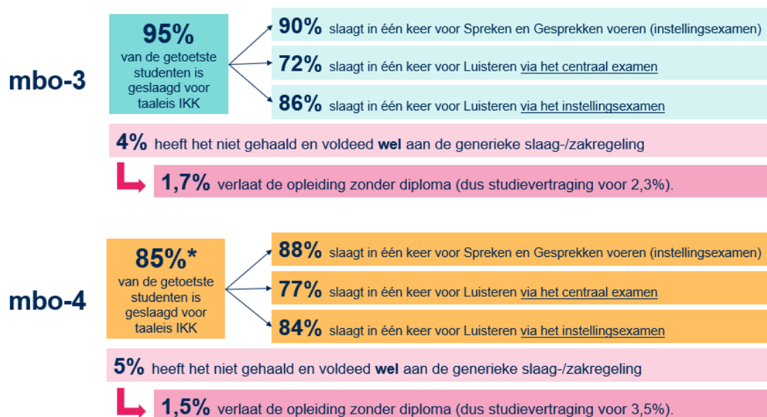
Figuur 4. Cijfermatige stand van zaken bij roc's op basis van de enquête. Cijfers hebben betrekking op het studiejaar 2022/2023 (* Zonder uitbijter: 92%)

Voor 4 - 5% van de studenten vormt de taaleis IKK het laatste obstakel in het afronden van hun opleiding. Zij voldeden in het studiejaar 2022/2023 wel aan de generieke diploma-eisen, maar niet aan de taaleis IKK. Als we dit extrapoleren naar het landelijke aantal getoetste studenten per jaar, dan halen circa 200 à 350 studenten per jaar de taaleis IKK niet, terwijl ze wel voldoen aan de generieke slaag-/zakregeling . Voor veel van hen resulteert dit in studievertraging. De groep die de opleiding verlaat zonder diploma valt hier ook onder (zie paragraaf 3.2.3).