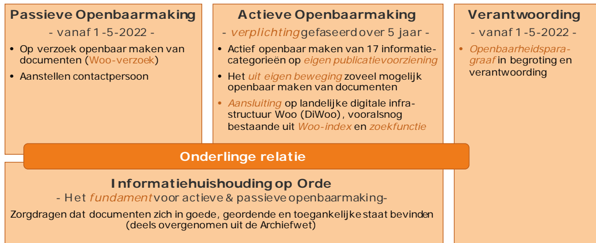
Figuur 1 – Verplichtingen Woo in hoofdlijnen

De wetgever heeft voor de implementatie van de Woo gerekend met een ruime invoeringstijd. De verplichtingen ten aanzien van passieve openbaarmaking zijn per 1-5-2022 van kracht geworden. Om de implementatie van de actieve openbaarmaking soepel te laten verlopen biedt de wet de mogelijkheid om deze verplichting gefaseerd in te voeren waarbij een invoeringstermijn van vijf jaar wordt voorzien.