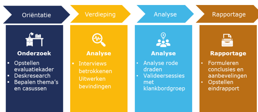
Figuur 1: Het door ons doorlopen onderzoeksproces

Daarnaast hebben we in meerdere sessies met de klankbordgroep (provincies, IenW, sectorpartijen) onze bevindingen gevalideerd en aangevuld en hebben wij er lessen uit getrokken. Een stuurgroep (provincies, IenW) heeft nauwlettend de koers van de evaluatie gevolgd. Tot slot hebben we een gesprek gehad met een vertegenwoordiger van de Nederlandse Vereniging van Luchthavens (NVL) om het NVL-perspectief op de conceptrapportage op te halen.