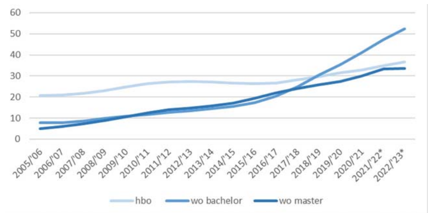
Figuur 1. Totale internationale studentenaantallen (x 1.000) 3

van daarbuiten (niet-EER-studenten). Het is een duidelijke trend dat steeds meer internationale studenten dankbaar gebruik maken van de mogelijkheid om hun studie, een deel van de studie of een stage binnen het Nederlandse hoger onderwijs te genieten.