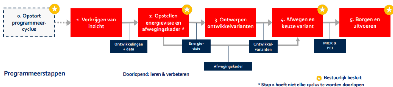
Afbeelding: Schema Integraal Programmeren