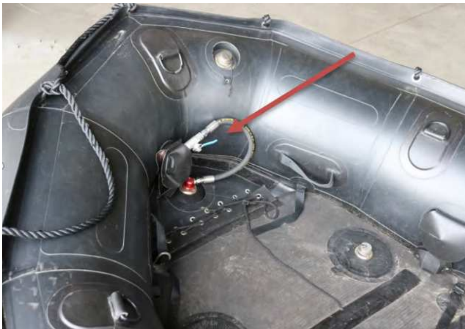
Figuur 3 Afsluiter in de boeg van een onbeschadigde Zodiac (bron: IVD)