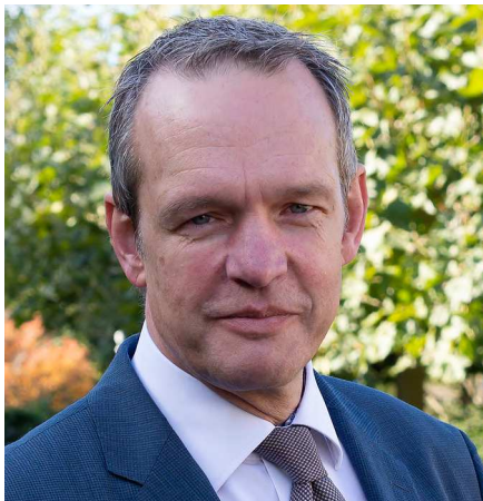
De Inspecteur-Generaal Veiligheid, Wim Bargerbos

De inspectie bedankt alle betrokkenen voor hun medewerking en hoopt met dit rapport handvatten te bieden om de benodigde verbeteringen vorm te geven.