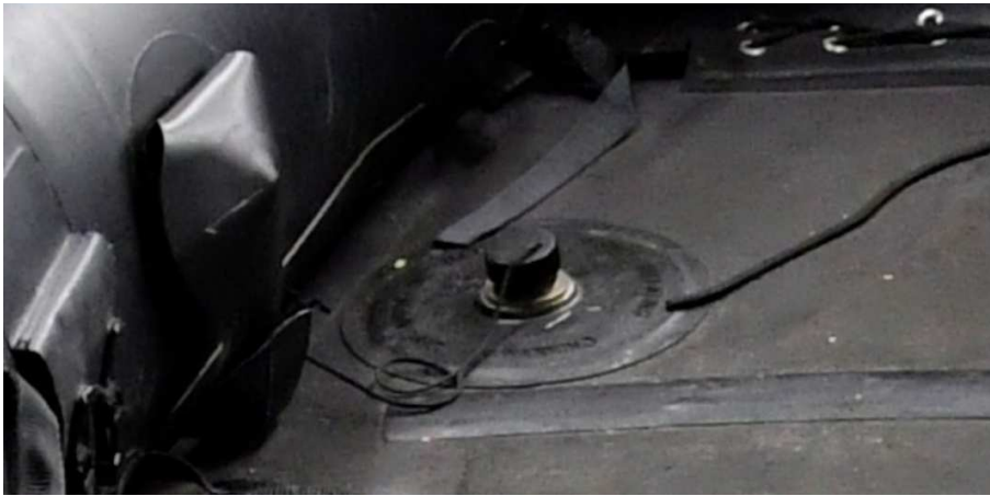
Figuur 4 Overdrukventiel met beschermdop bij een onbeschadigde Zodiac

Om te voorkomen dat tijdens het vullen de druk in een compartiment te hoog oploopt, zijn op verschillende plaatsen in de huid van de Zodiac overdrukventielen aangebracht. Deze beginnen af te blazen zodra de maximaal toegestane vuldruk is bereikt. De overdrukventielen zijn voorzien van kunststof beschermdoppen die vóór het vullen van de boot moeten worden verwijderd (figuur 4). Gebeurt dit niet, dan kan het ventiel zijn werk niet doen en loopt de spanning in het compartiment te hoog op. Het moment dat de overdrukventielen beginnen af te blazen, is voor de gebruiker het signaal dat het compartiment de juiste spanning heeft bereikt. De luchttoevoer vanuit de persluchtfles moet dan worden gestopt en alle nog openstaande afsluiters moeten met behulp van de hendels worden gesloten. Ten slotte worden de kunststof beschermdoppen weer aangebracht om luchtverlies tijdens het varen te voorkomen en de ventielen te beschermen tegen vuil.