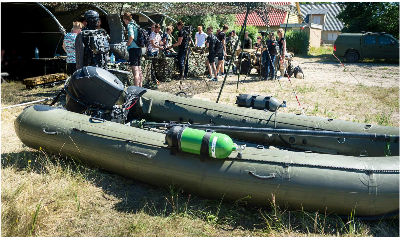
Figuur 7 DeBatts Rubber Rigid Inflatable Boat 5.20m zoals te zien bij de Infodag Korps Mariniers

De DMI heeft lessen uit onderzoek naar een eerder incident met een RRIB van MARSOF niet gedeeld met de leverancier, de fabrikant en gebruikers van vergelijkbare boten bij Defensie, waaronder het KCT.