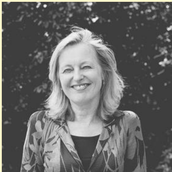
Prof. dr. M. (Jet) Bussemaker Voorzitter