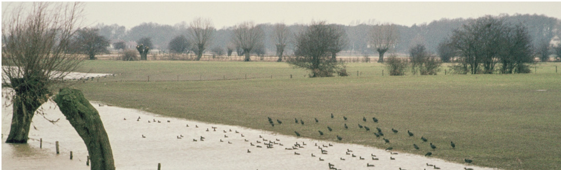
Rivierdijken: hoogwater in de IJssel, kwel binnendijks

Werk aan het rivierengebied is nooit af. Het programma Integraal Riviermanagement verbindt verschillende opgaven op het gebied van waterveiligheid, bevaarbaarheid, zoetwaterbeschikbaarheid, waterkwaliteit, natuur en een (economisch) aantrekkelijke leefomgeving. De transities in de landbouw (natuurinclusieve landbouw, circulaire landbouw) en de stikstofaanpak (Programma Natuur van het ministerie van LNV) kunnen nieuwe kansen voor synergie brengen. Zo wordt het rivierengebied nóg mooier en natuurlijker.