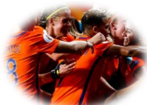
Oranje Leeuwinnen – finaleplaats WK 2019 (zeer) trots: 69%