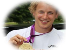
Epke Zonderland – goud op de rekstok OS 2012 (zeer) trots: 66%