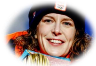
Ireen Wüst – meest succesvolle Olympiër ooit (zeer) trots: 65%