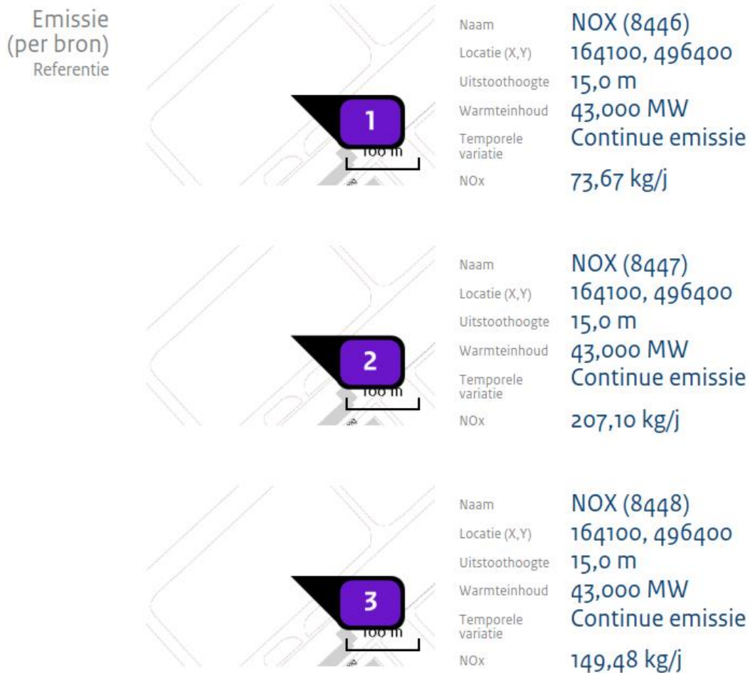
Figuur 5 Overzicht van de emissie details van enkele bronnen (onderdeel G en H).

De AERIUS pdf sluit af met onderdeel I. Dit onderdeel geeft, naast de disclaimer, informatie over de gehanteerde AERIUS versie en database, zie figuur 6.