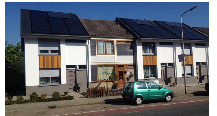
DE SERIE VAN N+1 IN KERKRADE