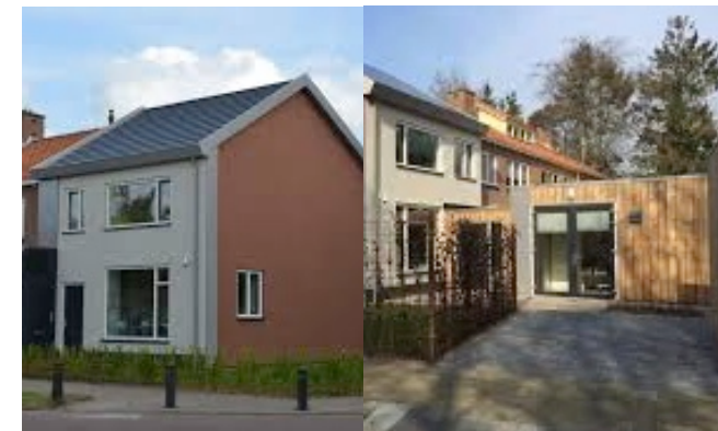
COMBI NOM EN LANGER THUISWONEN