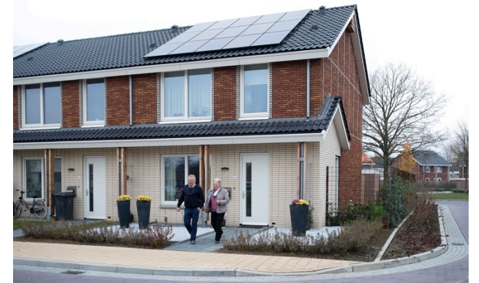
KWALITEITSIMPULS KRIMPGEBIED ULFT