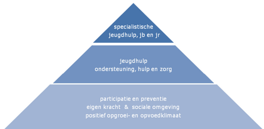
Figuur 2. Opbouw jeugdhulp, jeugdbescherming (jb) en jeugdreclassering (jr)

Figuur 2 geeft aan dat het voor het grootste gedeelte van de jeugdigen en hun ouders gaat om het bevorderen van een positief opvoed- en opgroei-klimaat, waar geen jeugdhulp nodig is. Een kleinere groep jeugdigen en hun ouders hebben ondersteuning nodig in de vorm van een voorziening. Slechts voor een zeer kleine groep jeugdigen en hun ouders er onvoldoende in slagen om hun opvoedingsverantwoordelijkheid waar te maken en hun kinderen in de ontwikkeling worden bedreigd, of wanneer een jongere een strafbaar feit heeft gepleegd. Gesloten jeugdhulp, kinderschermingsmaatregelen en jeugdreclassering worden opgelegd door de rechter en uitgevoerd onder verantwoordelijkheid van en gefinancierd door de gemeenten.